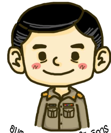
อบต.ลาดตะเคียน ยินดีให้บริการ

องค์การบริหารส่วนตำบลลาดตะเคียน ถนนฉะเชิงเทรา-นครราชสีมา อำเภอโกบรินทร์บุรี