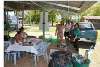
ศูนย์วัสดุรีไซเคิล