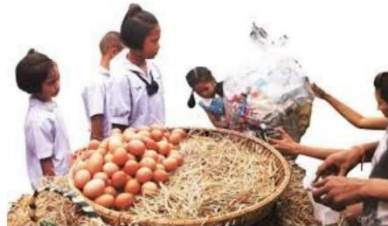
ขยะแลกไข่, สิ่งของ