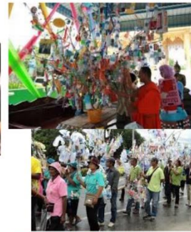
ผ้าปารีไซเคิล