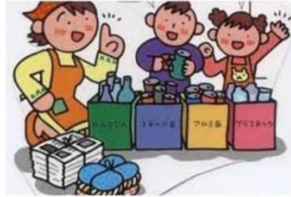
ธนาคารขยะ